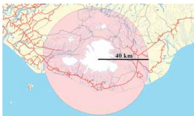
Im Falle eines Vulkanausbruches im Umkreis von 30-40 km von Katla gibt es viel Elektrizität

Im Umkreis von 30-40 km von Katla gibt es viel Elektrizität und damit erhöhte Blitzgefahr. Bitte suchen Sie Schutz in Berghängen oder an Hügeln und meiden Sie die Gipfel. Wenn Sie im Auto Schutz suchen, schliessen Sie bitte die Türen und Fenster. Benutzen Sie keine Radio- oder andere Fernsprechanlagen. Ist man in einer Gruppe unterwegs müssen die einzelnen Personen jeweils mindestens fünf Meter Abstand voneinander halten.